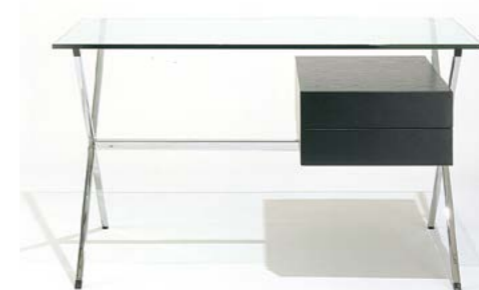
Bureau Franco Albin 3636 € + écotaxe 2,50 € KNOLL