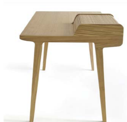
Bureau Tapparelle en chêne naturel, design Emmanuel Gallina 2040 € + écotaxe 1,50 € COLÉ ITALIAN DESIGN LABEL

Au moment de la rentrée, les bureaux sont également à l'honneur. Le Bon Marché Rive Gauche propose la nouveauté de la jeune marque italienne Colé, ainsi qu'une pièce plus emblématique de la célèbre marque Knoll. Une belle collection de papeterie créée par la marque Hay sera mise en avant pour accessoriser avec élégance notre mobilier de rentrée.